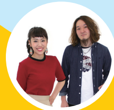
rüüa T-1ライブグランプリ2011 グランプリ 第3代大正区音楽振興大使