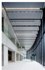
(学)常翔学園 OIT梅田タワー 1階ギャラリー