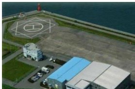
小川航空(株) 舞洲ヘリポート