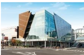
大阪ガス(株) ハグミュージアム