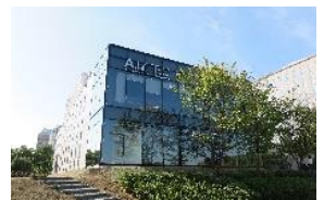
日立造船(株) 先端情報技術センター