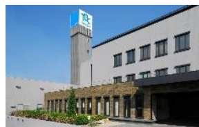
(株)タブチ 本社工場