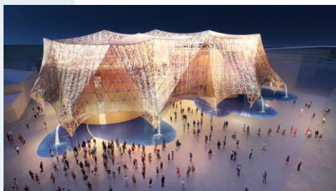
大阪ヘルスケアパビリオン全景パース