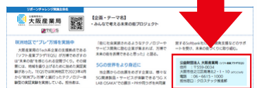
▲例 大阪産業局 (TEQS) の内容

これまで発行してきたニュースレターには、各企画の問い合わせ窓口を掲載しています。どこに連絡すれば良いかわからない場合は、各記事の以下の箇所を参考にしてください。