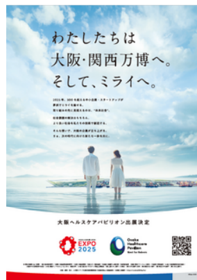
▲展示・出展ゾーン ポスター

なお、このポスターは原則、出展企業とリポーンチャレンジ実施主体にしか配付していないので、実物をご覧いただいた場合は、当ゾーンの関係者に巡り合ったということになります。お見かけた際は、当ゾーンへの想いなどを聞いていただければ幸いです。