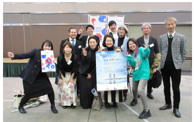
▲ポスターを持って記念撮影を行う出展企業、実施主体の皆さん