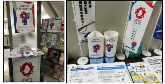
PRコーナー設置イメージ

各商工会議所の事務局内の受付やパンフレットコーナーの付近等、普段から多くの人が目にする場所、また地元イベントなどでのチラシやポスター等を用いたPRコーナーを設置。