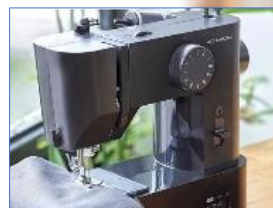
累計15万台突破 「子育てにちょうどいいミシン」

略歴 大阪の老舗ミシンメーカー3代目、2015年就任。「子育てにちょうどいいミシン」が2020年最大3か月待ちヒット、国内デザイン賞(グッドデザイン賞金賞、キッズデザイン賞優秀賞、JIDAデザインミュージアムセレクション)3冠達成、大阪活力グランプリ特別賞受賞、2023年NY近代美術館でベストセラー選出。2025年トヨタ車体の特許技術活用により立体物に直接縫える「MIRAIミシン」開発。独自のアイデア製品で市場を再定義、ヒットを生み出している。