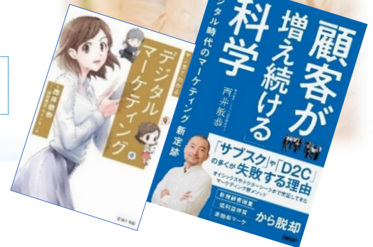
(講師著書写真)「顧客が増えない」「広告効果が見えづらい」「売上が頭打ちになっている」と悩む経営者にお勧め ※著書は配布致しません