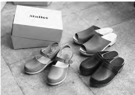
北欧の伝統靴・ウッドクロックの魅力を大阪の工房から発信