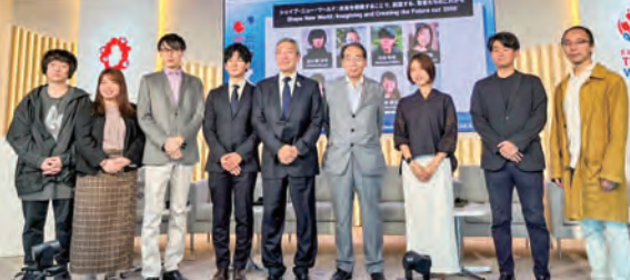
「EXPO KANPAI NIGHT」は、多くの参加者でにぎわった＝2025年5月、大阪市