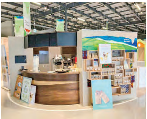
Double Doorsはブルンジババリオから依頼を受け、コーヒー豆を輸入した＝大阪・関西万博会場のブルンジババリオ

録する情報も聞けるらしいと話があった。「万博で仕事ができたら」24年6月、もずやんモールに登録した。その後、ブルンジからコーヒー豆の輸入の仕事をもらった。コーヒーを生豆で輸入し、日本の協力を手伝ったことになり、万博後もブルンジと取引を続けることになり、同社のレストランでデザート、コーヒーを提供するほか、Eコマースでもあった。なかには300*もある大造の彫刻もある見込みだ。