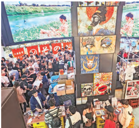
「EXPO KANPAI NIGHT」は、多くの参加者でにぎわった＝2025年5月、大阪市