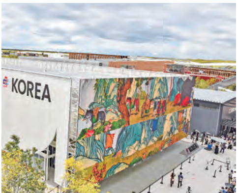
大屋根リングの上から一望できる外壁の大型発光ダイオードLEDビジョンの迫力ある映像に来場者が魅了された＝2025年10月、大阪・関西万博会場

大阪商工会議所は、2024年にKOTRAに就職した。大商とは、販路開拓や技術提携に向けた商談事業などにおいて連携してきた。万博の閉幕後、関西国際空港に行ったところ、万博会期中より訪日客が多かった。こうした海外の方々には大阪に関心を持ち続けていたことが今後の課題と考える。南大阪の活性化のためにKOTRAの行事に参加する韓国企業がグレート・ミナミに足を運ぶ機会を作ったり、小グループでDeep Osakaを観光していたり、個人旅行の方にもEXPO跡地見学などのプログラムに参加したいという声が多い。こうした感で取り組みを進めていきたい。