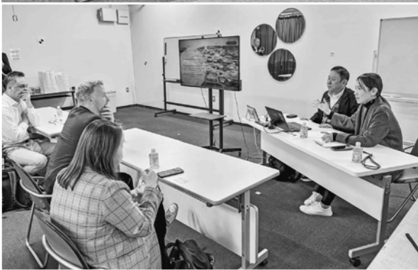
●万博リポーンチャレンジ出展企業と海外企業が商談した12月9日、大阪市●海外企業が「グローバルポーション」を視察した12月10日、箕面市