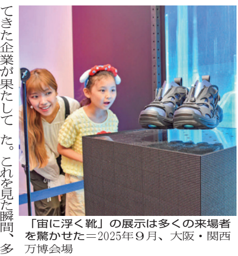
「宙に浮く靴」の展示は多くの来場者を驚かせた＝2025年9月、大阪・関西万博会場

万博の出展が決まり、喜んだもののそこからは大変だった振り返る。またに出展する企業とミートアップを重ねた結果「宙に浮く靴」を作ることにした。堅い地面を歩く靴を作った喜ばれ てきた企業が果たして「宙に浮く靴」を作れるのか、不安になったが、万博は実現可能なものを展示する場ではなく、できずともないことに挑戦する場であると気持ちよく切り替えた。 共創する企業とともに工夫を重ね、万博会場最終の9月下旬、電磁石の反発を利用して空中に浮かせる特殊なゴム素材の山本化学工業)を使用した「宙に浮く靴」を展示した。社員も成長が見られた。大きな収穫だ。 「楽しく歩く人をふやす」が同社の経営理念。今はまた「宙に浮く靴」の実用化のめどは立っていないが、介護現場で働く人の負担を軽減したり、歩行に困難を抱えた人に歩くことに希望を持つていかなければ、挑戦は続く。