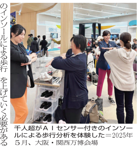
千人超が「AIセンサー付きのインソール」による歩行分析を体験した＝2025年5月、大阪・関西万博会場

万博には、靴に入れて歩く、歩行年齢や姿勢癖、足指力がわかる人工知能(AI)センサー付きのインソール(歩行AI)を出展。これは豊田合成が開発したもの。このインソールによる歩行分析の体験に対する来場者、万博出展後は、ほぼ1時間待ちの状態。予備軍の方を対象にAIインソールを使って正しい歩き方を指導する。笑顔で歩いてもいい血糖値をく美しく歩き続けたいという下げていく取り組みにも参加。 病氣予防にいかにお金を出してもうかがが一つの課題だ。「健康になる」と中高年齢者に呼びかけても、心に響かない。ハイヒール」とか「ゴルフ」といったキーワードを使って引き付けていきたい。