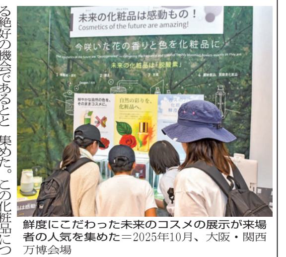
鮮度にこだわった未来のコスメの展示が来場者の人気を集めた＝2025年10月、大阪・関西万博会場

る絶好の機会であるところから出展を決意した。協業している香料会社(大阪市)と出展したのには「究極のオードーメイ化粧品」のフース。香もの！のフースでは、鮮度にこだわった未来のコスメのあり方を展示。自然のままの色や香りをコスメに展開するものをつ販売するの「肌診断化粧品」の人気の高かった。普通の製法と比べて脱酸素製法では香りがよいと好評だった。人気の韓国や中国のコスメに対し、日本初の脱酸素製法を用いた化粧品を商品化して人気を博す可能性をつかめた。2026年1月の化粧品開発展や海外展開も視野に入れて、積極的に販路開拓していく。