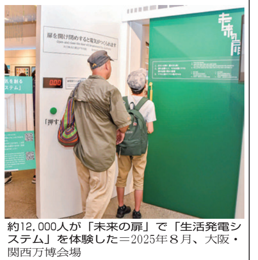
約12,000人が「未来の扉」で「生活発電システム」を体験した＝2025年8月、大阪・関西万博会場

動扉閉閉システムは、吊り下げ引き戸を自動ドアにすることで高齢者も軽い力で引きの開閉ができることで高齢化社会の暮らしをサポートを自指す。 出展期間の1週間、約1万2千人が体験。1万回を超えたあたりから倍速ギアシステムに具合が生じることもあり、改良が必要であることがわかった。