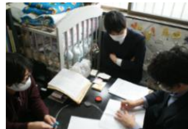
（上写真）弁護士が入念に最終チェック。事業譲渡契約書に、調印。