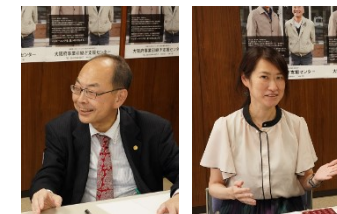
左：大阪府事業承継・引継ぎ支援センター上宮統括責任者/右：兼田承継コーディネーター