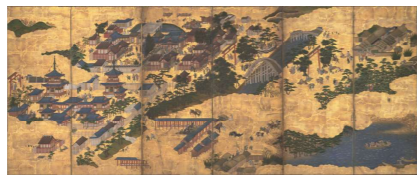
11月 《四天王寺住吉神社図屏風》(部分) 17~18世紀