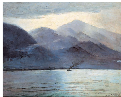
6月 赤松麟作《雨後(芦ノ湖)》1934年