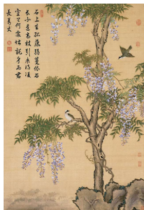
4月 蔣廷錫《藤花山雀図》(部分) 18世紀