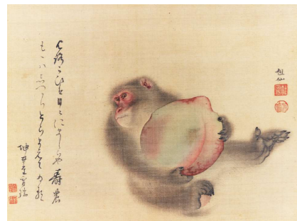
7月 森狙仙《桃に猿図》18~19世紀