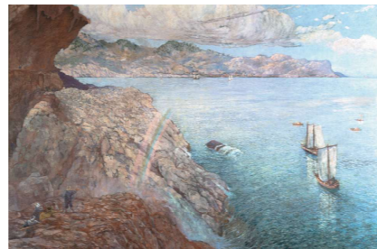
9月 山内愚僊《海景》1917年