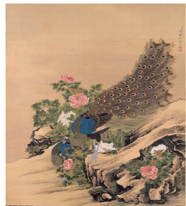
5月 岸駒《牡丹孔雀図》1785年