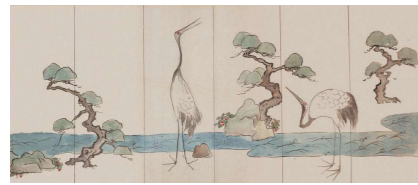
1月 尾形光琳《松鶴図屏風画稿》17~18世紀