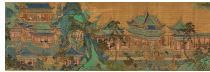
3月 仇英《九成宮図》(部分) 17世紀