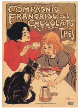
2月 テオフィル=アレクサンドル・スタンラン《チョコレートと紅茶のフランス商会》1895年