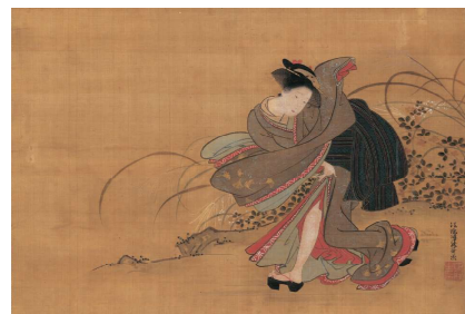
10月 磯田湖龍齋《秋野美人図》18世紀