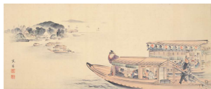
8月 西山完瑛《納涼船遊図》19世紀