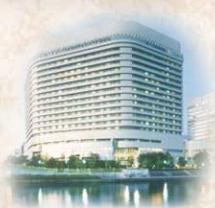
ホテルニューオータニ大阪4F