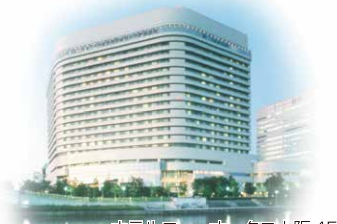
ホテルニューオータニ大阪4F

ご所属の健康保険組合様のご契約を利用してのご受診も可能です。 その場合は、上記キャンペーンの適用外となる可能性がございますので、 詳しくはお気軽にお問い合わせください。