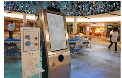
大阪商工会議所が支援した実証実験の様子