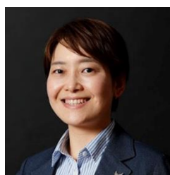
大家 桃子 氏