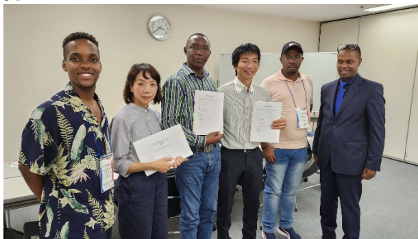
大阪商工会議所にて