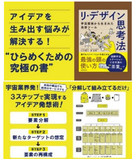
本図版は講師著書『リ・デザイン思考法』実務教育出版HPより転載