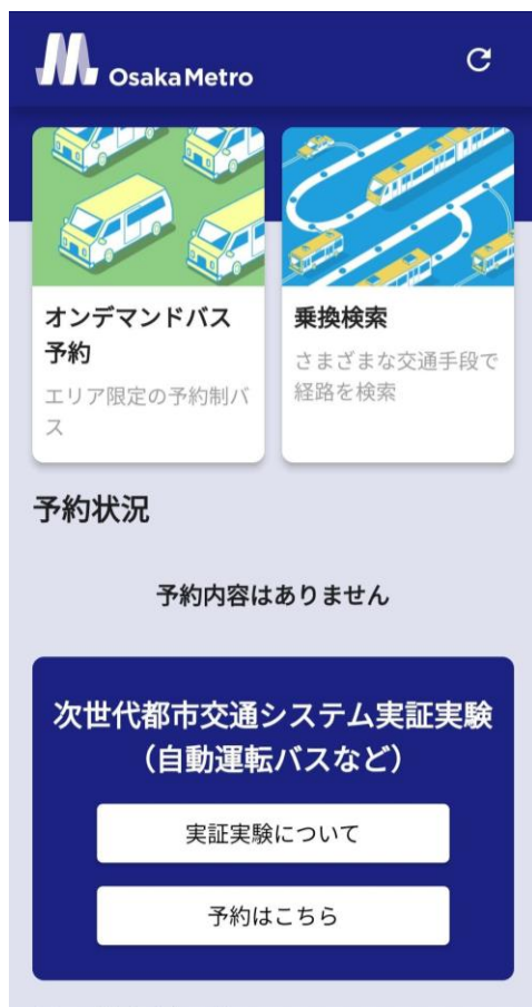
アプリホーム画面