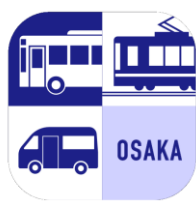
「Osaka MaaS 社会実験版」 アプリ

iPhoneの場合は「App Store」で、Androidの場合は「Google Play」で、「大阪マース」を検索しダウンロードしてください(対応機種・OSについては、iPhoneはiOS13.0以上、AndroidはAndroidOS6.0以上となります)。