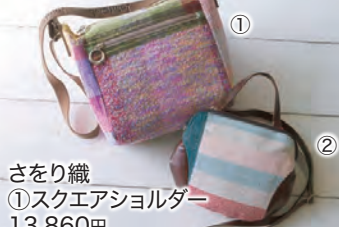
さをり織 ①スクエアショルダー 13,860円 ②ポシェット 12,100円