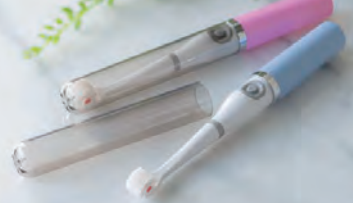
クルンソニックポータブル 各3,300円

超極細毛で歯垢を絡め取る、電動ローラー式歯ブラシ。外出先でも使え、2分程度でつるつるに。