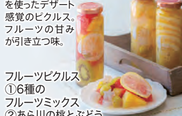
フルーツピクルス ①6種のフルーツミックス ②あら川の桃とぶどう ③メイヤーレモン 各210g 各918円

泉州や紀州などの野菜とくだものを使ったデザート感覚のピクルス。フルーツの甘みが引き立つ味。