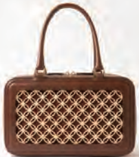
花組子ハンドバッグ 110,000円