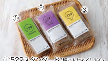
①529スタンダード(板こんにやく) 250g ②529スレッド(糸こんにやく) 180g ③529ドット(粒こんにやく) 180g 各381円

真面目なこんにやく作りを信条に、堺で創業90年以上。おしゃれなパッケージにも注目!