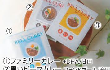
①ファミリーカレー +DHA/甘口 ②黒いビーフカレー フォンドボー入/辛口 ③ポークカレー オイスターソース入/中辛 各180g 各501円

日本で最初に固形カレーを開発し、多彩な味を手掛けてきたメーカー自慢のオリジナル品。