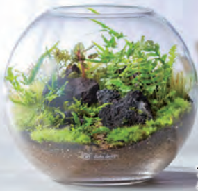
ナンバーズ シダテラリウム 29,700円

シダのテラリウムで“小さな自然”を身近に。簡単なお手入れで楽しめる、癒しのインテリアとしてお部屋を彩ります。