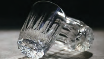
シリコンロックグラス 各4,950円

素材はクリアガラスに並ぶ透明度のシリコンゴム。精度の高さと美しさに大阪の職人魂を感じる逸品。