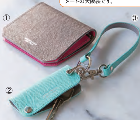
①ミニウォレット 17,600円 ②スリムキーケース 3,300円 ③マルチストラップ 2,310円

発色性と耐久性に優れたカウレザーを使用した、機能的で美しいレザーグッズ。1点ずつハンドメイドの大阪製です。