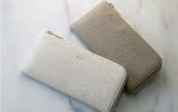
ラウンドファスナー長財布 各19,580円

大阪靴協会所属の企業が関西圏で製造・生産。協会の品質基準を満たした確かな靴・小物を。