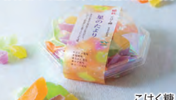
こはく糖 星のたより 錦秋 90g 432円

美しく愛らしいお菓子は、すべて職人による手作り。モダンな感性で華やく伝統の和菓子です。