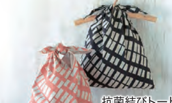
抗菌結びトートリバーシブル 各2,750円

使い勝手がよく、洗練されたデザインの家用品を製作。長く愛用したくなる存在感が魅力。