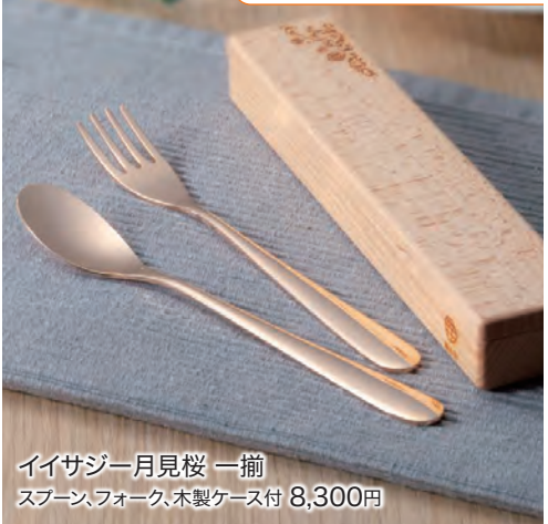
イイサジ一月見桜 一揃 スプーン、フォーク、木製ケース付 8,300円

くちびるが感動するカトラリー。小さく薄く平たい設計で、口もとを汚すことなく美しく食事を楽しめます。