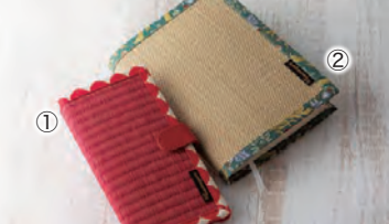
①畳のスマートフォンケース 3,608円 ②い草のブックカバー 1,760円