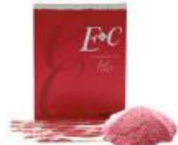
健康食品 エラスチン1/50& コラーゲン JULIO E&C

この特許(アルカリ抽出)により製造した高分子エラスチン素材の輸出、及び高分子エラスチン素材を使った化粧水、乳液、美容液、フェイスマスク、クリーム等「julio」化粧品、健康食品、褥瘡被覆シートの輸出を行う。また、2020年から中国深圳市において高分子エラスチン素材を独占製造・販売予定。