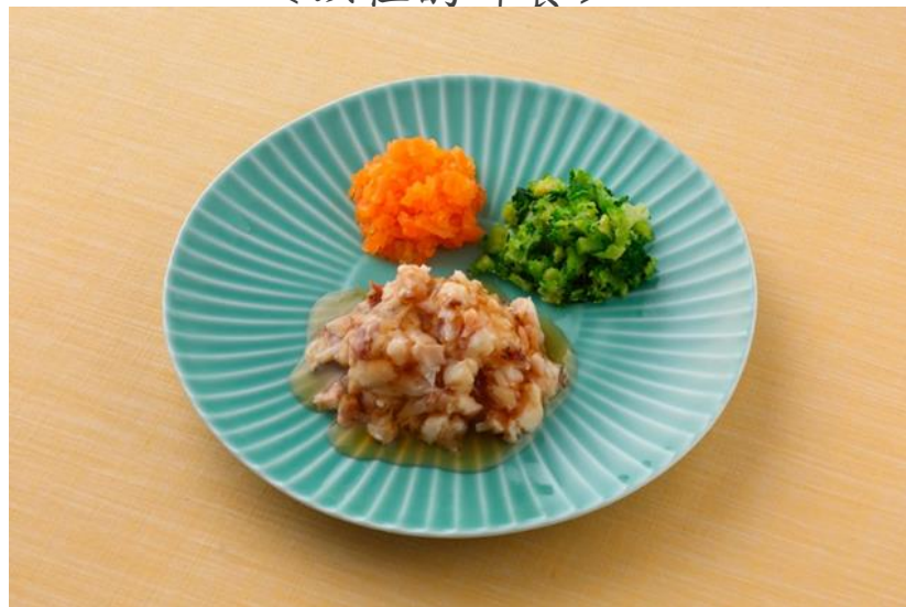
< 以往的碎食 >