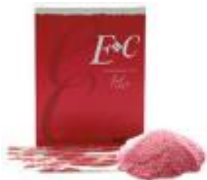
化粧水 JULIO ELASTIC LOTION

这个专利根据（硷性提取）制造的高分子弹性蛋白素材的出口，及出口使用高分子弹性蛋白素材的化妆水，乳液，美容液，面膜，雪花膏等*julio*化妆品，健康食品，褥疮被覆贴的出口。并且预定从2020年在中国深圳市生产制造销售。