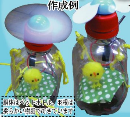
胴体はペットボトル、羽根は、柔らかい樹脂でできています

写真は試作したもので実際のものとは異なる場合があります。ご了承ください。 中に入っているひよこは、見本に入れたもので実際には入っておりません。入れたいものがあればお持ちください。直径2cm位までならOKです。