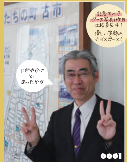
ヒデサン 古市小学校 校長先生

次号では「BIKE Works 回転馬車」(ロードレーサー、マウンテンバイク専門店)を大特集します！乞うご期待！