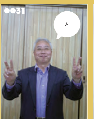
ノボチャン タンバ家具