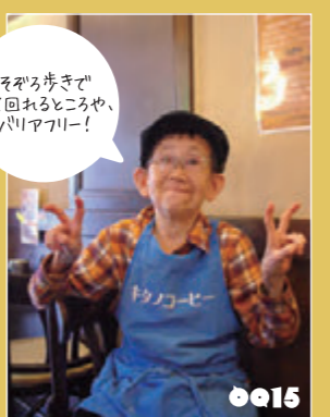
フーテンの虎太郎 キタノコーヒーマスター