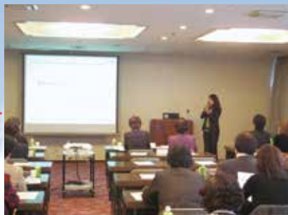
事例発表会（講師と会員）

表紙デザインは創立50周年記念として女性会より大阪商工会議所に寄贈した緞帳の図柄です。