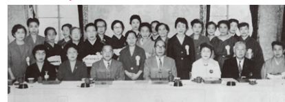
大商婦人会発会式