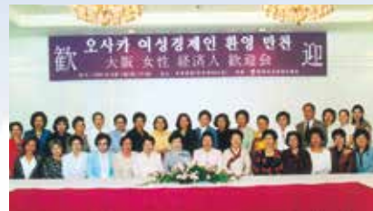
韓国女性経済人協会との懇談会

全国各地の女性会との交流を深めるため懇談会を開催しています。海外の女性経営者との交流会を行うこともあります。