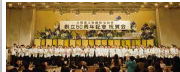
大商女性会創立50周年記念