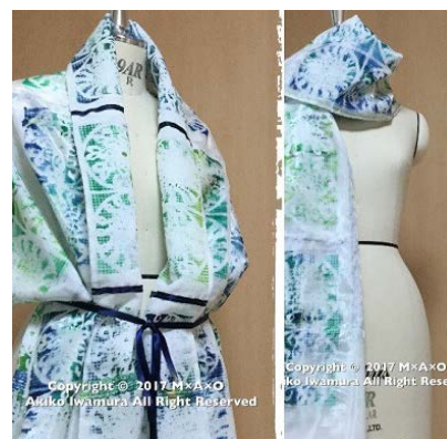
意匠登録済ストール

もともと、大阪はアパレルの街。インパクトの強い関西ならではのファッションだけでなく、表参道や渋谷などの洗練されたブランドも、大阪のアパレル発であることが多い。これからの女性活躍社会に向け、大阪発のファッションデザイナーが飛翔することを期待したい。