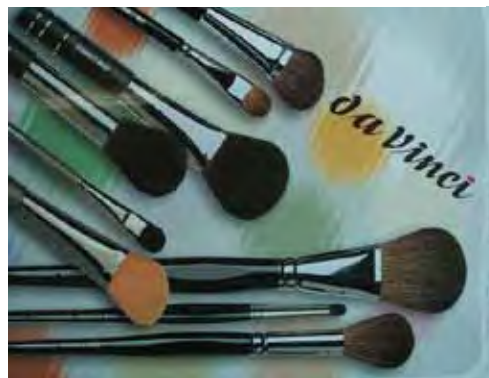
ダヴィンチ化粧筆