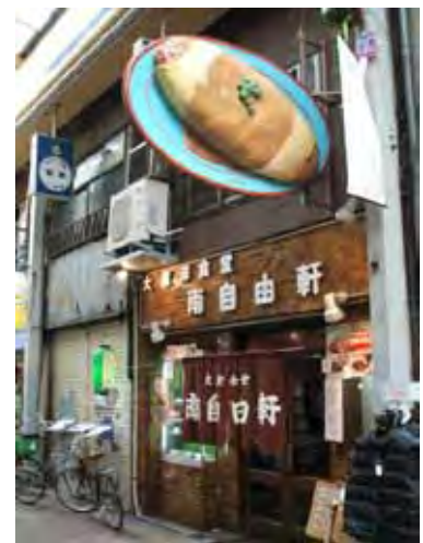
巨大なオムライスの看板が目印の店

更なる円高が進み、外需の取り込みや国際化、国内の空洞化の問題がまた取り沙汰されるようになった昨今、創業90年の伝統を守るためには、「できることからチャレンジする」むしろ攻めの姿勢が必要だと、改めて感じさせられる下町の商店街の老舗飲食店である。