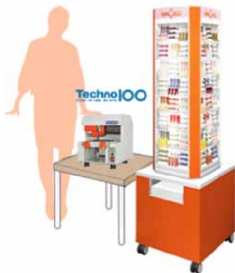
1坪ビジネスを実現する「テクノ100」とタワー什器

顧客は店頭で目に付くタワー什器に納められた印材を選ぶ。可愛い和紙の模様が埋め込まれたもの、キャラクターの模様が入ったもの、ネイルアートのような細工を施されたものなど様々な種類からお気に入りのものを選べる。パソコンの画面上で印面を確認すれば、ネーム印なら5分もかからず