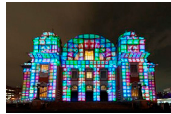
大阪市中央公会堂