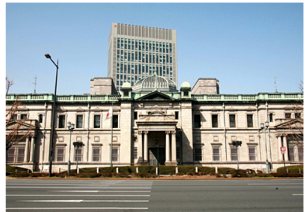
日本銀行大阪支店