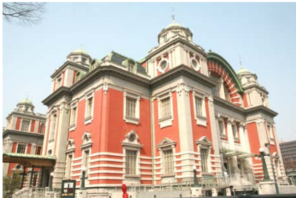
大阪市中央公会堂