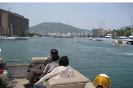
【徳島】都心部を巡る、ひょうたん島遊覧船