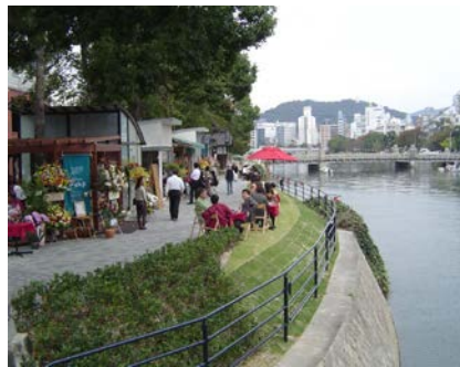
【広島】水辺のオープンカフェ