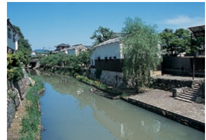
【近江八幡】観光のシンボル・八幡堀