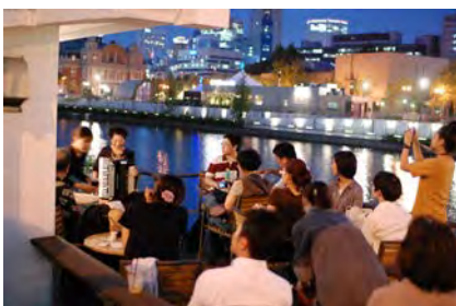
【大阪】日本初の常設川床「北浜テラス」