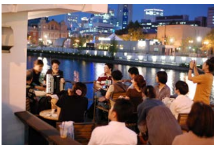
【大阪】日本初の常設川床「北浜テラス」