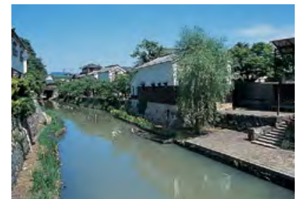
【近江八幡】観光のシンボル・八幡堀