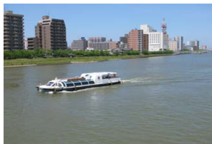
【新潟】市民株主のクルーズ船