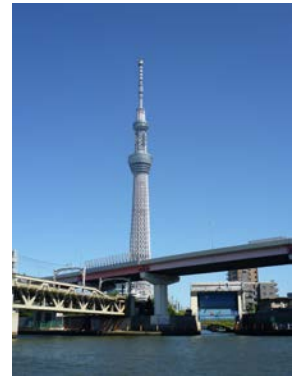
【東京】スカイツリーが楽しめる 隅田川クルーズ