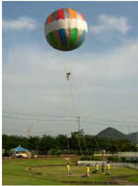
（バルーンイメージ）

（詳しくは御堂筋 kappo2011 ホームページ http://kappo2011.jp をご覧ください）