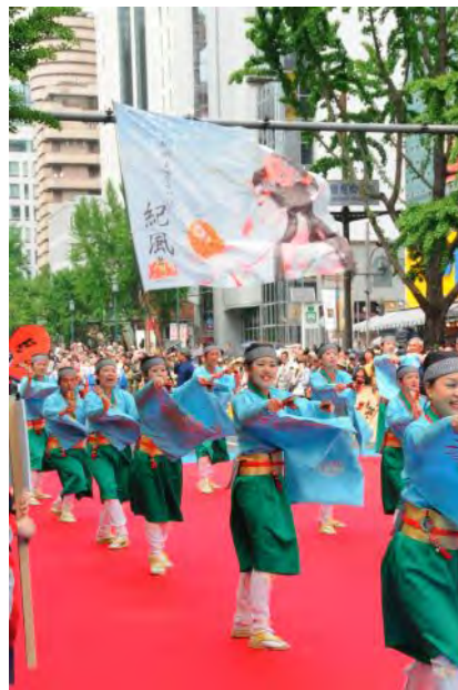
御堂筋みなこいグランプリ