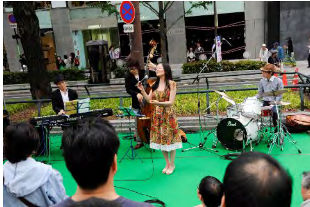
ミナミジャズウォーク