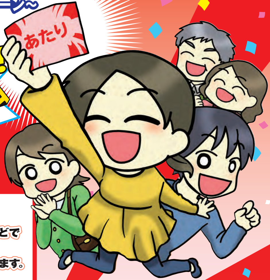
イラスト：大阪市立デザイン教育研究所 デザイン学科2年 三神菜花 作

キャンペーンに参加する お店・商店街・小売市場などで お買い物をすると スクラッチカードがもらえます。