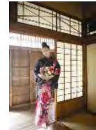
大桑マイミプロデュース浴衣 「真凜(まりん)」