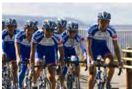
シマノレーシングチーム

エシカルなサイクル(環境や社会に配慮した良い循環)とサイクル(自転車)を掛け合わせた、エコと結びついた自転車マナー向上のためのイベント。ファミリーから若者まで正しい自転車マナーを、楽しみながら体験しよう！