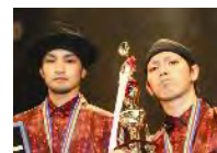
GUEST: Boogaloo injection

【出演】(下図上段左より)MORTAL COMBAT、Body Carnival、ULTRA BRA1N、INCLINE、 SINCE、JUNGLE BROTHERZ、ARMAR BRATS、サクラ大戦