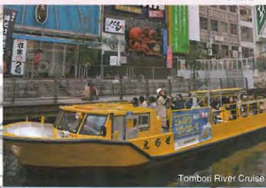
Tombori River Cruise