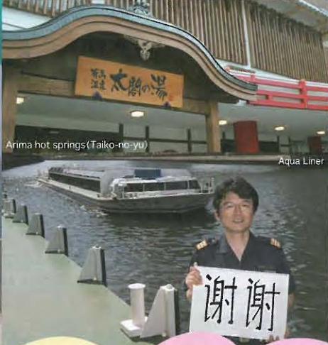
Arima hot springs (Taiko-no-yu)