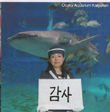
Osaka Aquarium Kaiyukan