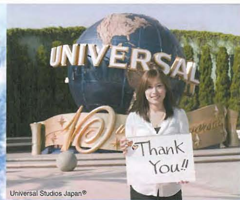
Universal Studios Japan®