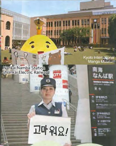
Nankai Namba Station (Nankai Electric Railway)