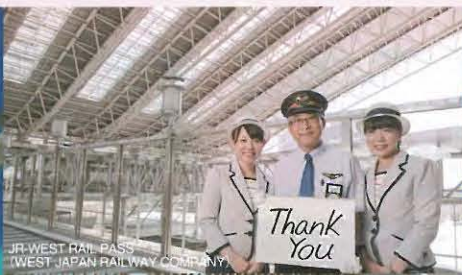
JR-WEST RAIL PASS (WEST JAPAN RAILWAY COMPANY)