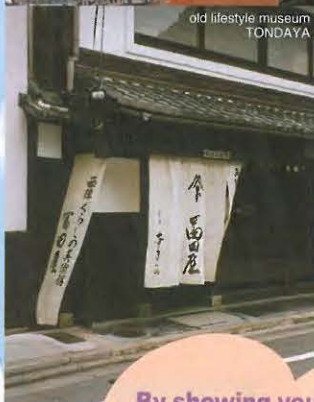
old lifestyle museum TONDAYA