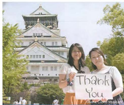
Osaka Castle Museum