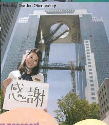
Floating Garden Observatory