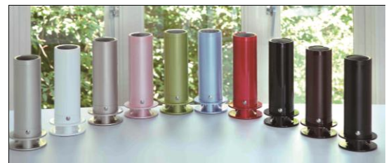
SuperPod スピーカー (10 色) 各 38,880 円～

株式会社シロクマは 1947 年に大阪で創業し、建築金物製造卸業を営んでいます。同社は、生演奏を聞いているような臨場感でオーディオファンの熱い支持を集める「タイムドメインスピーカー」の製造を行っています。京都の音響メーカー・タイムドメイン社とライセンス契約を結び、金物メーカーとしての豊富な金属加工技術を活かしてスピーカー本体の構成に必要なパーツを独自に開発。「SuperPod」についてはタイムドメイン社の指導の下、スピーカーユニットも新たに開発し、シロクマ社製のタイムドメインスピーカーが完成しました。タイムドメイン理論で作られたスピーカーはタイムドメイン社のほかに複数のメーカーが製造・販売を行っていますが、シロクマ社製のものは品質の高さはもちろんリーズナブルな価格設定になっています。生の音をそのまま再現し、小さな音も鮮明に聞こえるのが特長です。