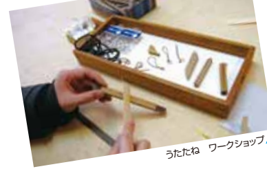
うたたね ワークショップ