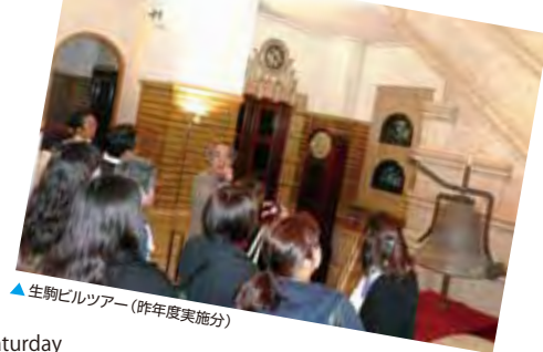
▲生駒ビルツアー (昨年度実施分)

まちあるきコンサート、特別見学会など、多彩なイベントを通じて水辺やまちの魅力をたっぷりお楽しみください。