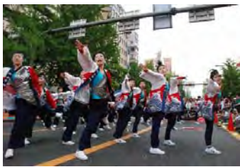
大阪府立今宮高校「ダンス部」

【出演】 大阪府立今宮高校 「ダンス部」 大阪市立住吉商業高校 「フォークソング部」 大阪府立芥川高校 「和太鼓部」 大阪府立富田林高校 「バトントワリング部」