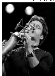
エリック・マリエンサル

【出演】 エリック・マリエンサル with Global Jazz Orchestra、京都コンポーザーズジャズオーケストラ、関西大学北陽高等学校、心太ジャズオーケストラ