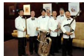
ニューサウスサイドジャズバンド