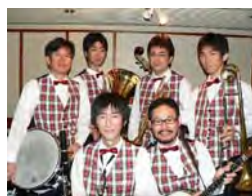
ハートビートディキシシーランド

【出演】 ハートビートディキシシーランド、マホガニーホールストンバーズ、ニューオーリンズレッドビーンズ、ニューサウスサイドジャズバンド