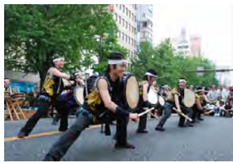
大阪府立芥川高校「和太鼓部」