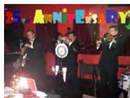
マホガニーホール ストンバーズ