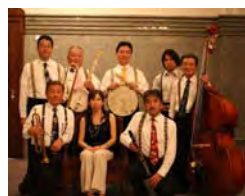
ニューオーリンズ レッドビーンズ