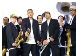
ブリッツ&スカッシュ ブラスバンド