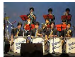
関西大学北陽高等学校