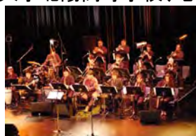
Global Jazz Orchestra