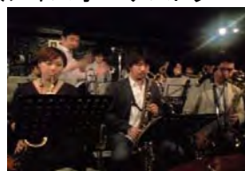
京都コンポーザーズ ジャズオーケストラ