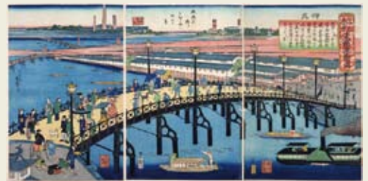
明治時代の高麗橋(浪花繁栄東堀鉄橋図:大阪府立中之島図書館)

東横堀川にかかる高麗橋、本町橋、農人橋の3橋は、江戸時代には、幕府が直接管理した「公儀橋」と呼ばれる橋でした。12の公儀橋のうち3橋が東横堀川に架かっていたとは、この界隈が交通の要所として栄えていた様子がうかがえます。なかでも重要視された高麗橋は、明治3年(1870)には、いち早くイギリスから輸入された大阪初の鉄橋に架け換えられ、「くろがね橋」と呼ばれたそうです。日本では長崎、横浜に次ぐ3番目の鉄橋でした。明治時代には里程元標がおかれ、西日本の主要道路の距離計算はここを起点に決められました。高麗橋という名前の由来は諸説あり、古代・朝鮮半島からの使節を迎えるために作られた迎賓館の名前とか、豊臣秀吉の時代、朝鮮との通商の中心地であったことに由来するとか…。東横堀川の橋はアーチが多く、鋼とコンクリート製がほぼ交互に並んでいます。デザインもそれぞれに異なり、独自の景観を作り出しています。偶然こうなったのではなく、大正から昭和初期の“大大阪”と言われた時代の設計担当者の意気込みが感じられます。